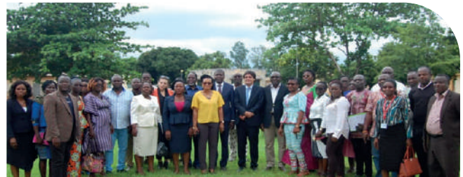
Vue des auditeurs et des intervenants View of auditors and stakeholders