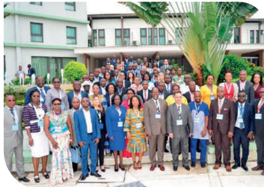
Photo de famille des participants et intervenants

« Gestion prévisionnelle des emplois et des compétences dans le secteur électrique africain »,