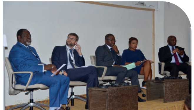
Une vue des intervenants A view of stakeholders