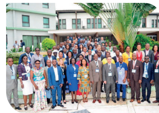
Family photo of participants and stakeholders